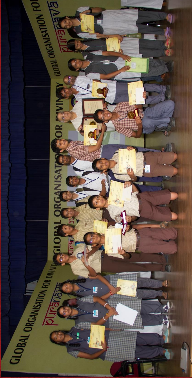
PURANAVA – INTERSCHOOL HERITAGE QUIZ, 12 th August, Chennai